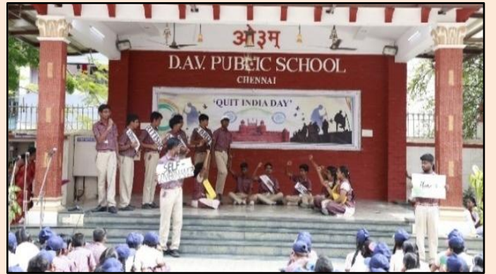
नाटक मंचन - ‘भारत छोड़ो आंदोलन’ की महत्वपूर्ण घटनाएँ