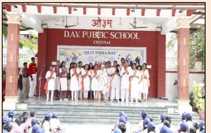
‘भारत छोड़ो आंदोलन’ के तीन चरण - एक झाँकी