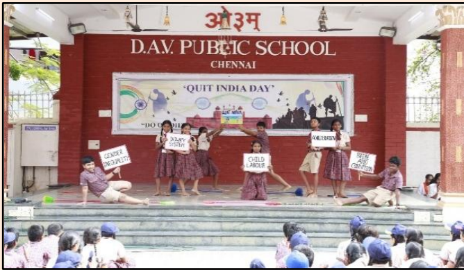
‘गंदगी भारत छोड़ो’-नृत्य प्रस्तुति