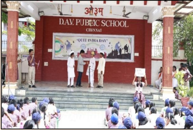
‘भारत छोड़ो आंदोलन’ की जटिलताएँ - एक झाँकी