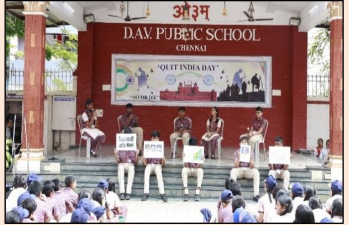
‘भारत छोड़ो आंदोलन’ की महत्वपूर्ण घटनाओं पर - पैनल चर्चा